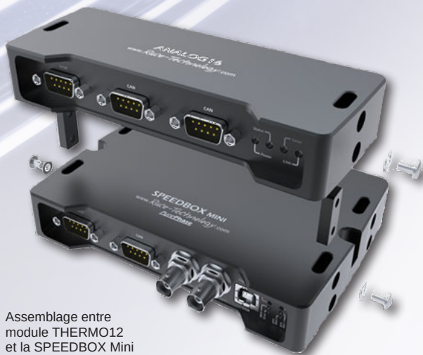
Assemblage entre module THERMO12 et la SPEEDBOX Mini

La suite logicielle qui accompagne gratuitement, tous les appareils de RACE Technology permet de régler aisément les modules mais aussi de visualiser et acquérir les mesures en temps réel, puis de les convertir ou les analyser. Les appareils complémentaires de la gammes RACE Technolo-